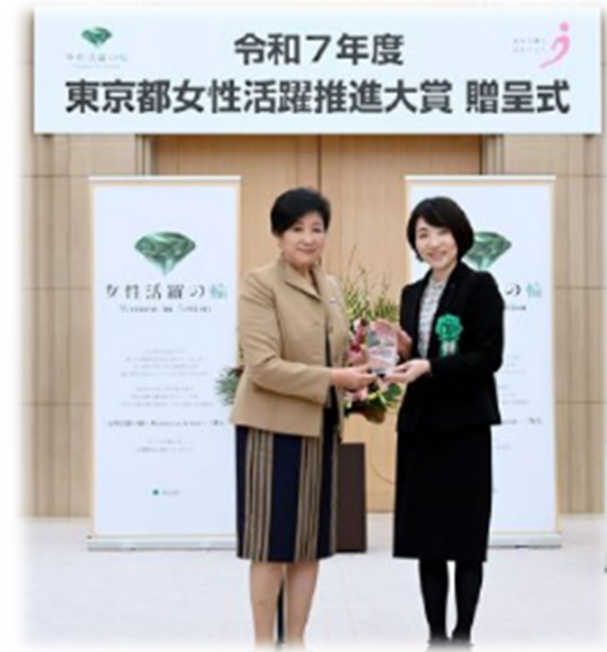
授賞式の様子(2026年1月)