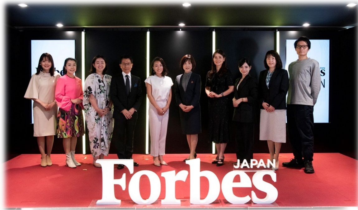
授賞式の様子(2024年9月)

Forbes JAPAN WOMEN AWARD 2024 ～企業特別賞「ポジティブアクション賞」を受賞～